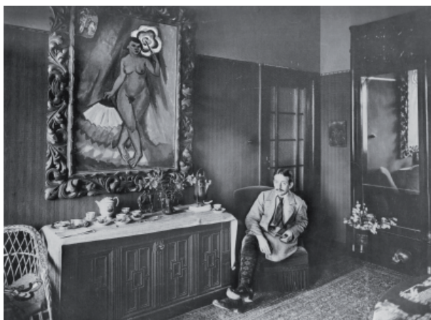
Max Pechstein i sitt hus i Berlin-Zehlendorf, 1915

Både uttrycket i hans konst och hans politiska engage-mang gjorde honom till måltavla för nazisternas avsky. Några år efter att de kommit till makten avsattes han från sin tjänst vid konsthögskolan, och 326 av hans konstverk på tyska museer beslagtogs. Efter krigs-slutet 1945 återfick han sin professur i Berlin, och fick de följande åren många hedersbetygelser och utmärkelser för sitt konstnärliga arbete. Sommaren 1955 avled han vid 73 års ålder.